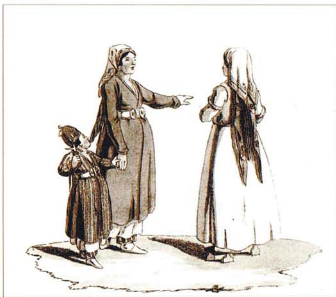
Мусульманки. Рисунок Х.Г. Гейслера, 1801 г. Из альбома «Народы России», Париж, 1812 г.

К этому времени Духовному собранию, находящемуся в Уфе, подчинилась почти вся территория, оказавшаяся в составе России с середины XVI до второй трети XVIII века, за исключением Таврической и западных губерний, Кавказа и Закавказья, Туркестана и степных областей. По мере хозяйственного освоения огромное пространство