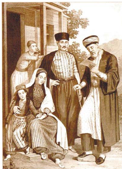
Мулла с прихожанами. Рисунок Е.Х. Паули, 1862 г.

...Изучив планы строительства Уфы, и заложив камень в фундамент новой церкви в честь Святого Александра Невского, император отправился в уезд-