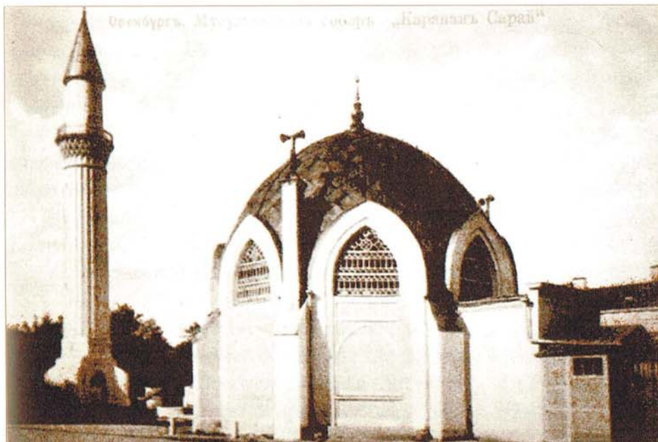
Здание Караван-сарая в г. Оренбурге было построено по инициативе оренбургского генерал-губернатора В.А. Перовского по проекту архитектора А.П. Брюллова в 1838-1844 гг. для размещения в нем канцелярии командующего Башкиро-мещерякским войском и устройства почлега для приезжих мусульман. Включает мечеть и минарет высотой около сорока метров

Каждый день прислуга приносит неленицы, одна гуще другой. То, будто бы, вышел приказ, чтобы в каждом доме заготовить несколько гробов, и как только кто захворает, сейчас же дать знать об этом