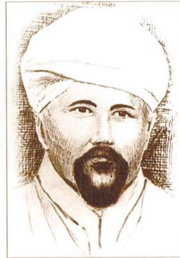
Муфтий Габдельвахит Сулейманов

Поскольку соответствующую подготовку в этой области имел гражданский мулла, главный начальник Пажеского и всех сухопутных кадетских корпусов